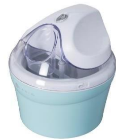
Maquina de Helados