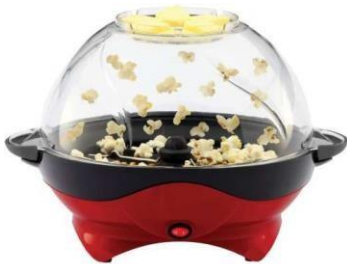
Pop Corn Maker