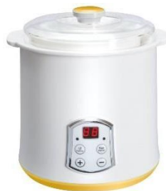
Yogurt Maker Pro