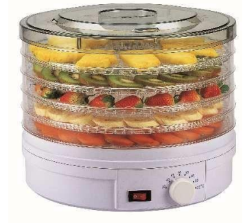
Deshidratador de Alimentos