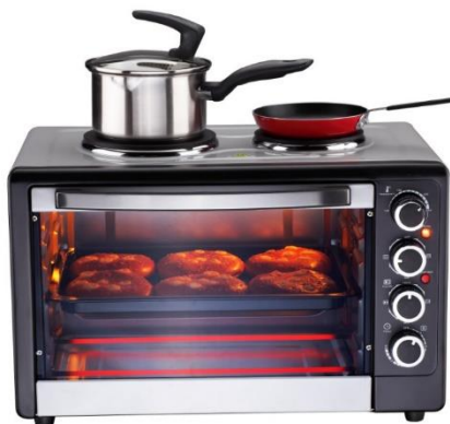
Hornos de 45 y 68 lts con placas