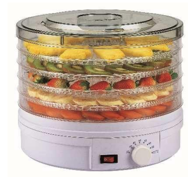
Deshidratador de alimentos