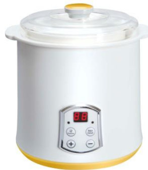
Yogurt Maker Pro