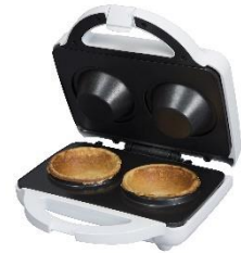
Waffle Bowl Maker