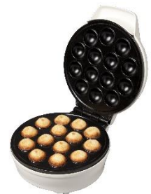
Cake Pop Maker

SI QUIERES SABER COMO SE USAN NUESTROS PRODUCTOS VISITANOS EN NUESTRO CANAL YOUTUBE BLANIK TV