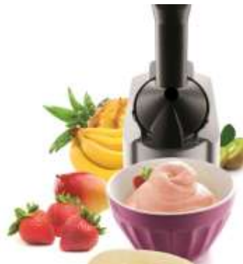
Frozen Fruit Maker