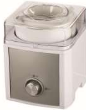
Máquina de Helados