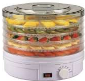
Deshidratador de Alimentos