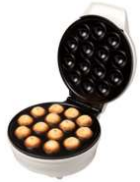
Cake Pop Maker