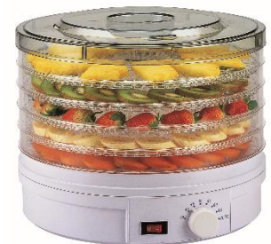
Deshidratador de Alimentos

SI QUIERES SABER COMO SE USAN NUESTROS PRODUCTOS VISITANOS EN NUESTRO CANAL YOUTUBE BLANIK TV